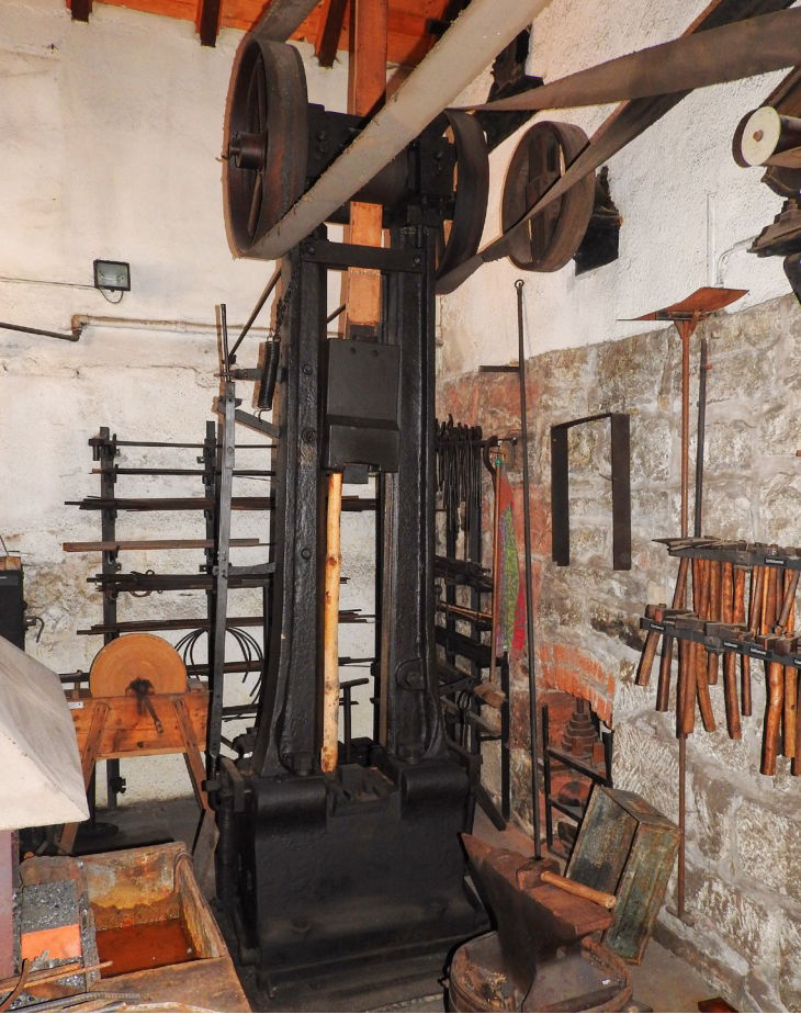
Der älteste Brettfallhammer Deutschlands (Baujahr 1867) hat bis 1917 in der Königlich Preußischen Gewehrfabrik in Erfurt gearbeitet.