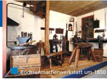
Büchsenmacherwerkstatt um 1850