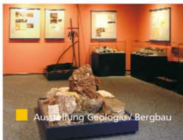
Ausstellung Geologie / Bergbau