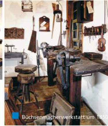
Büchsenmacherwerkstatt um 1850

Die repräsentative Sammlung Zella-Mehliser Waffen gibt eine Vorstellung von der einstmalig blühenden Waffenindustrie unserer Stadt. Firmen wie Carl Walther oder I.G. Anschütz trugen den Namen der Waffenstadt in die Welt.